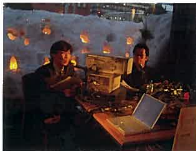
しりべし i ネットラジオ(ミニFM)

i ネットカフェで「初めてこのサイトを知った」というお客様もあり、i ネットの認知度向上の一役を担うことができましたようです。