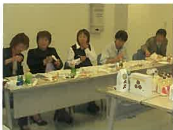
紹介された商品を試食