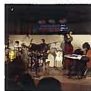
雪あかりコンサート