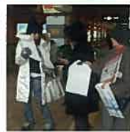
JR小樽駅 i センター