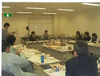
前に出てそれぞれPRを行いました