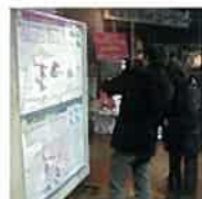
ゆきみち・おたるんテーリング