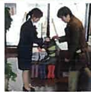
雪みちも安心・長靴貸し出し