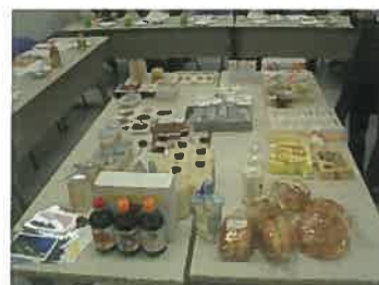
集められた数々の特産品