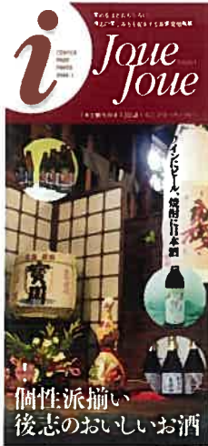
メンバーが初めて手掛けたテーマは「お酒」