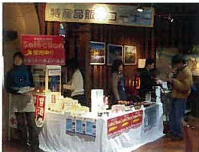
特産品販売コーナー

観光ユニバーサルデザインの促進に向けたイベントプログラムでは、ホテルノルド小樽での「長靴貸し出し」を実施し、メディアから高い評価をいただいたそうです。それに関連し、雪道に不慣れた観光客等に「つつるマップ」を配布し、安全な歩行を促す情報提供を行いました。それらの情報は、2日間限定で設置した「JR小樽駅 i センター」や「ミニFM」でも案内され、「後志魅力展」会場への誘致を促進することができました。