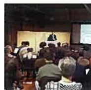
観光のユニバーサルデザインフォーラム in 小樽