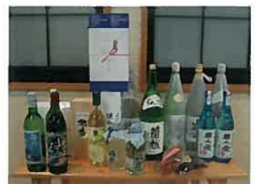
1日目に試飲されたお酒

今年度から取り組む「セレクション事業」は、しりべしシステム事業の自主運営に向けた基盤づくりを目的としてスタートしました。そのための基盤づくりとして、地域のスタッフの方々にも自分たち以外の特産品を勉強してもらおうと、スタッフ研修会で「まず既存の特産品を知ろう!」というテーマで、実際に味わいながら確認を行いました。