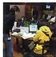
しりべし i ネットカフェ