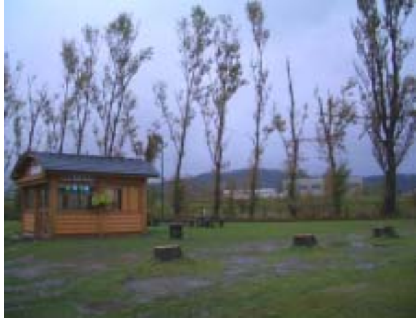
台風前の雰囲気・・・

9月8日強い勢力を持って上陸した台風18号。余市消防署の記録では最大瞬間風速43.1mだったそうです。センター周りのポプラの木々には無事な木が1本も無いほどの痛々しい姿でしたが、それらの木々が守ってくれたのか、センターには強い風が送り込んだ葉の切れ端や窓からの雨の吹きつけによる大掃除状態となりましたが大きな損傷は有りませんでした。